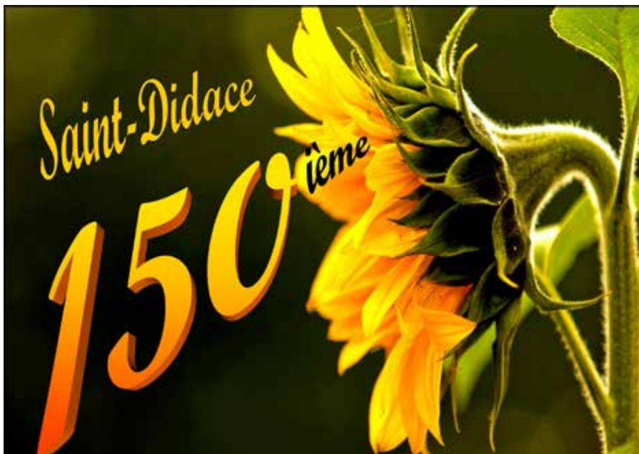
image officielle enfin dévoilée

Le Comité des Fêtes du 150 e de Saint-Didace est très heureux et fier de vous dévoiler l'image qu'il a fait multiplier en grand format pour vous. À Saint-Didace, on est fier de s'afficher ! Vous découvrirez à l'intérieur les cadeaux que nous vous avons préparés.