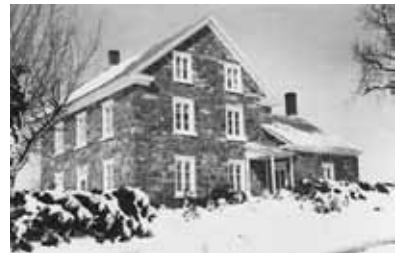
Maison Hamelin 1959. Rue du Pont

Il est officier de l'Ordre du Canada, correspondant de l'Académie des sciences morales et politiques (France) et grand officier de l'Ordre national du Québec.