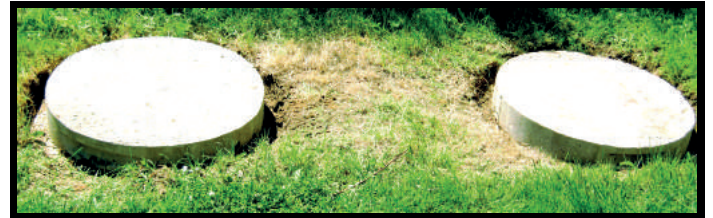
Couvercles bien dégagés