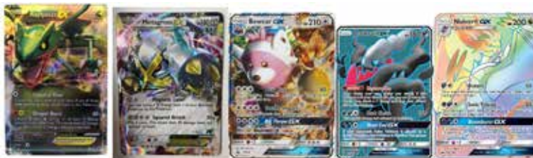
SHAWN DELLEY 5 e année

garnis. Tout d'abord, je vais vous parler de mes cartes favorites. Les voici : Darkrai gx, Bewear gx, Rayquaza EX, Noivern GX, Metagross EX. Je les préfère parce qu'elles sont belles et très puissantes. En plus, elles sont très rares. Maintenant, parlons des belles cartes pour moi. Voici leurs noms : Salamence v, Tapu fini gx, Zarude V. Finalement, voici de belles photos de mes cartes préférées.